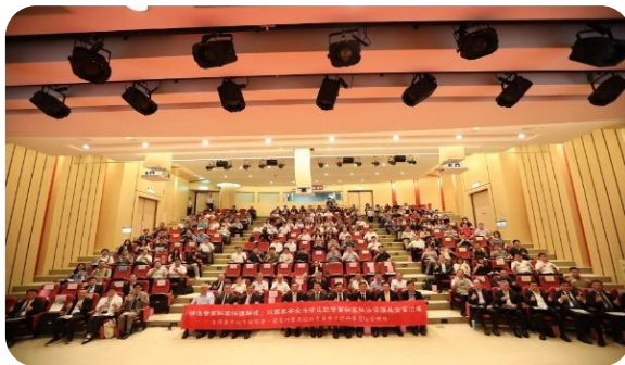
1130507 中科園區 精華照片

「 科學園區高科技企業服務廉政平臺 」乃結合機關施政方向，倡導公私協力、跨域合作，以深化交流方式，協助園區企業重視誠信治理及法遵議題。本會與法務部未來將持續攜手合作，推動多元企業廉政服務，以促進政府與企業的共榮共好。