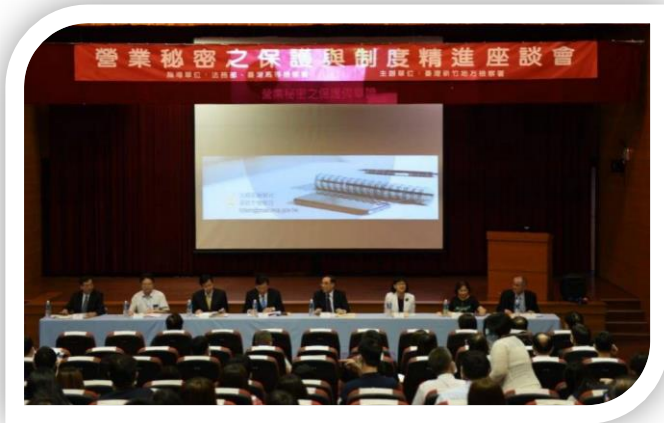
竹科管理局場次座談情形

各科學園區管理局政風室並於會前發送 2019 年全球清廉印象指數 (CPI) 等反貪腐摺頁文宣，傳達我國在 8 個涵蓋臺灣之原始資料的計算下，得分為 65 分，排名全球第 28 名，分數較 2018 年增加 2 分，名次則是進步 3 名。分數和排名皆創下我國的新高，顯示近年來我國推動公私部門廉政協力已獲得國際社會的肯定，更確認公私部門在建立營業秘密保護的方向。