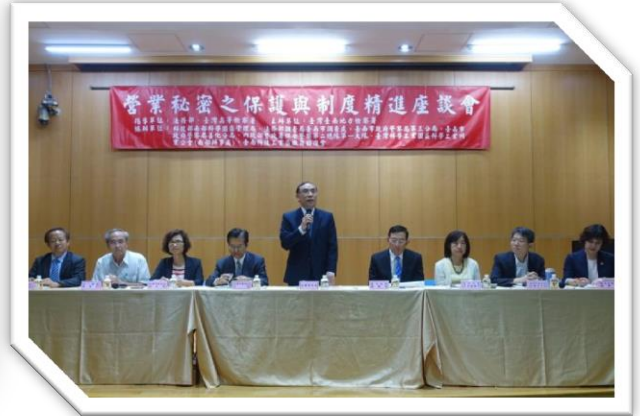
南科管理局場次法務部蔡部長致詞