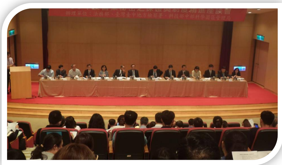
中科管理局場次座談情形