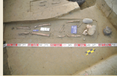
▲ 大湖期墓葬遺骸頭部時常會以石塊覆蓋，為現今台灣考古學中少見之葬俗。