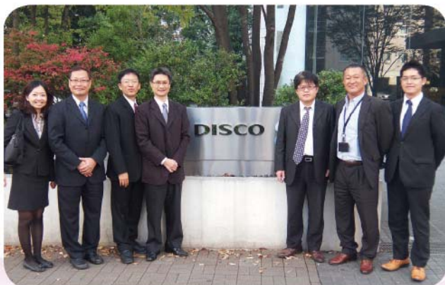
▲ 率團訪問日商DISCO (104.11.12)