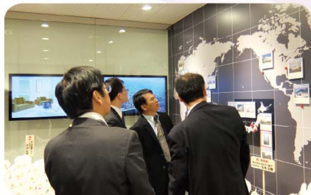
▲ 南科參展團隊拜訪NCI公司 (104.02.26)

2月25日至27日PV EXPO 2015第8屆日本國際太陽光電展在日本東京盛大展出，本次園區共有6家園區廠商一同參展，南科管理局於26日在展場發表「台灣南部科學工業園區綠能低碳產業聚落介紹」，推廣園區。此次行程另外拜訪了JRI、日立先端、日立國際電氣、NCI、SONY等5家日商，積極尋求台日產業未來合作交流的商機。