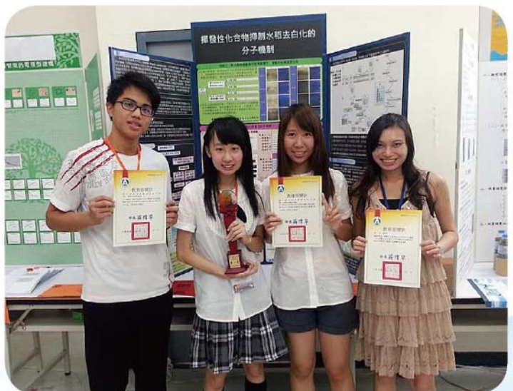
▲ 第53屆全國科展生物科第一名