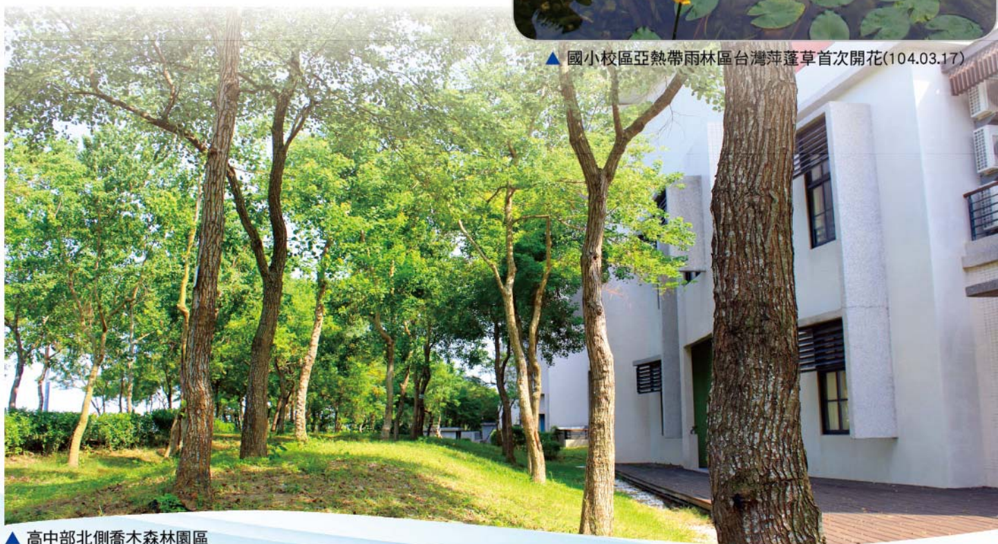
▲ 高中部北側喬木森林園區

南科實中綠典計畫邁入第三年「茁壯期」，104年結合高瞻計畫、校園美感環境再造等計畫，持續對生態環境的照護與推動綠色科技教育，推動成果逐漸獲得全國各級學校的矚目，許多國內外友校慕名而來，參訪人數已經累計超過2,500人。