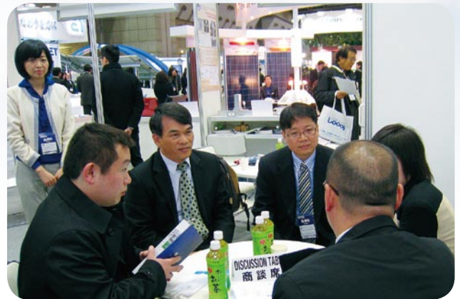
■ 「第7回太陽電池展」に出展した南科館が海外メーカーの関心を集める (2014.02.26)