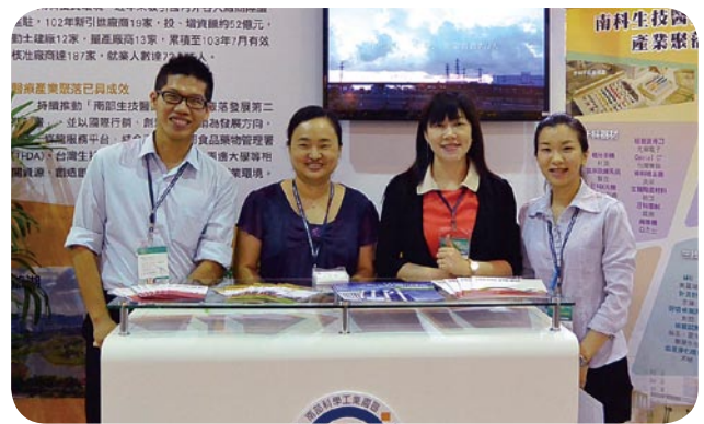
■ 「2014台湾生技大展」に出展した南科主題館 (2014.07.24)

「2014年台湾生技大展 Bio Taiwan」が7月24から27日まで、台北の世貿中心南港展覽館で開催されました。南科からは入居企業9社と金属工業研究發展センターが共同で「南科バイオ産業主題館」を出展し、国内外の商社や企業の代表の注目を集めることができました。