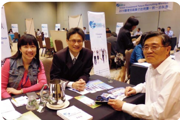
■ シリコンバレーのサンタクララ・コンベンションセンター にて一対一の面接 (2014.10.19)