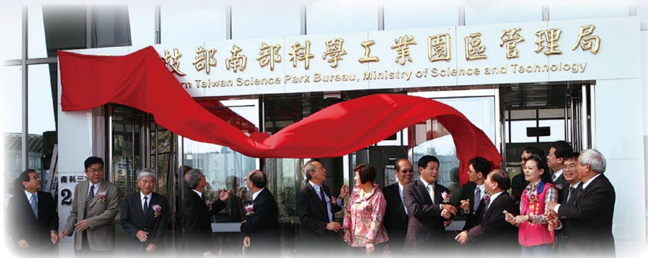
■ 科技部南部科学工業園區管理局揭牌式 (2014.03.05)