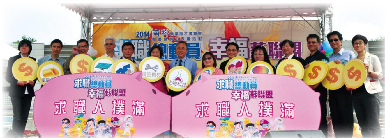
■ 意志あるところに道は拓ける (2014.04.26)