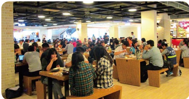
■ 改装後、より明るく快適になった台南園区PARK17