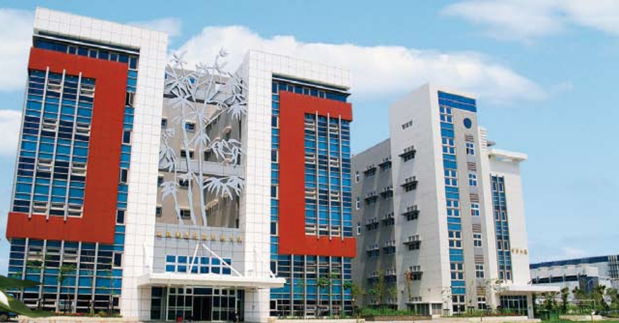
高雄園區行政サービス棟