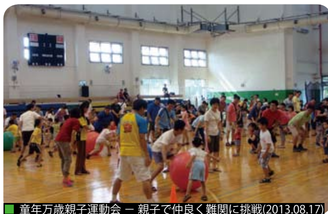
■ 童年万歳親子運動会 - 親子で仲良く難関に挑戦(2013.08.17)