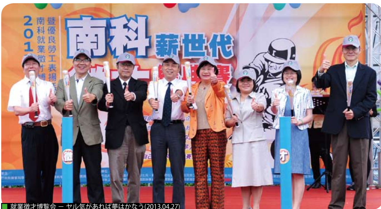
■ 就業徴才博覧会 - ヤル気があれば夢はかなう(2013.04.27)

4月27日、西拉雅広場において「2013南科就業徴才博覧会暨優良勞工表揚活動」が開催され、40社が採用活動を行いました。当日はのべ3000人以上が来場し、この日の段階で企業による求人の8割以上がマッチングに成功。また、会場では各事業者が推薦する模範的な労働者52名に対する表彰式も行われました。