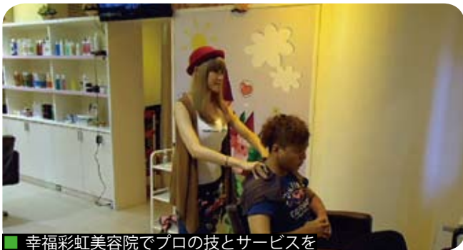
幸福彩虹美容院でプロの技とサービスを

台南園区の宿舍の住民にとって生活の場であり、住民同士の交流を深める場でもある社区センターには、軽食喫茶、カフェ、コンビニ、ヘアサロン、文化教室、音楽教室、幼児教育、歯科クリニックが入って住民のニーズに応えています。2013年には幸福彩虹複合式サロンと南科美術教室がオープンし、より多様な生活サービスの提供が可能になりました。