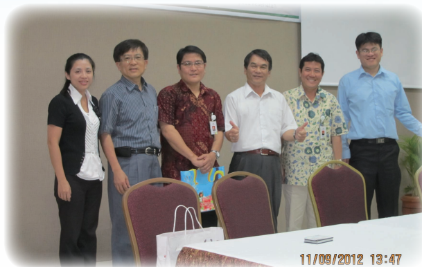
■ 訪問先の Eka Hospital にて (2012.11.08)