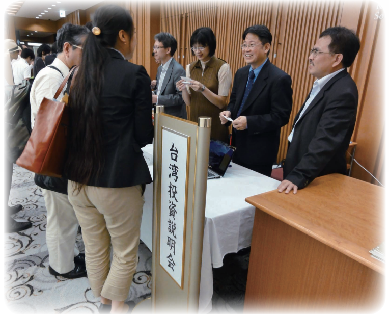
■ 東京の経団連会館で行われた台湾投資説明会には多くの人が集まった (2012.07.11)

日台提携のメリットをアピールしてより多くの日系企業の南科進出を促すため、南科管理局は7月8日から13日まで経済部の「2012年促進投資及産業合作訪日団」とともに訪日し、誘致活動を行いました。南科管理局は忙しいスケジュールの合い間を縫って日立、大日本印刷、住友商事、JX日鉱日石金属、日本電産など世界的な大企業を積極的に訪問。また、7月11日、12日に東京と大阪で行われた「台湾投資説明会及び相談会」では台湾への投資や産業提携についてアピールしました。当日は満員の大盛況で、出席した企業担当者からは南科の恵まれた投資環境についても熱心な質問が相次ぎました。