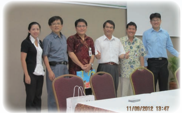
■ 拜訪 Eka Hospital 合照 (101.11.08)

接軌的指標」主題發表演說，期許能夠充分整合產、官、學、研、醫資源，持續推展生技醫材的研發能量與創新。