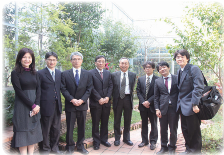
■ 財團法人北九州產業學術推進機構參訪 (101.01.17)

2012 年世界科學園區協會年會（IASP）於 6 月 17 日至 20 日在愛沙尼亞首府塔林（Tallinn）舉行，會中發表「南部科學園區與區域創新網絡關係之探討（The Study of the Relationship