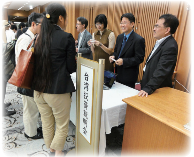
■ 於東京經團連會館舉行台灣投資說明會暨諮詢會，現場交流熱絡 (101.07.11)

為彰顯台日合作優勢，引進更多日商進駐南科，南科管理局配合經濟部「101年促進投資及產業合作訪日團」，於7月8日至13日在日本進行一系列的招商訪問行程。除一般招商訪問外，南科管理局亦積極拜訪包括日立集團、大日本印刷株式會社、住友商事、JX日礦日石金屬株式會社、日本電產株式會社等多家國際大廠，並於7月11、12日期間分別在東京、大阪舉辦「台灣投資說明會及諮詢會」，吸引日商來台投資、進行產業合作，當日現場座無虛席，南科優質的投資環境也獲得現場廠商相當熱烈的探詢及迴響。