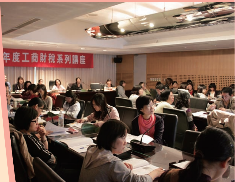
▼ 99年度工商財稅系列講座園區財會人員參與情形(99.11.18)