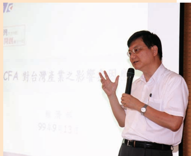
▼經濟部工業局局長杜紫軍進行專題演講(99.9.13)