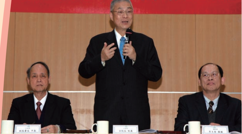
▼ 行政院院長吳敦義與南科廠商進行座談(99.3.11)