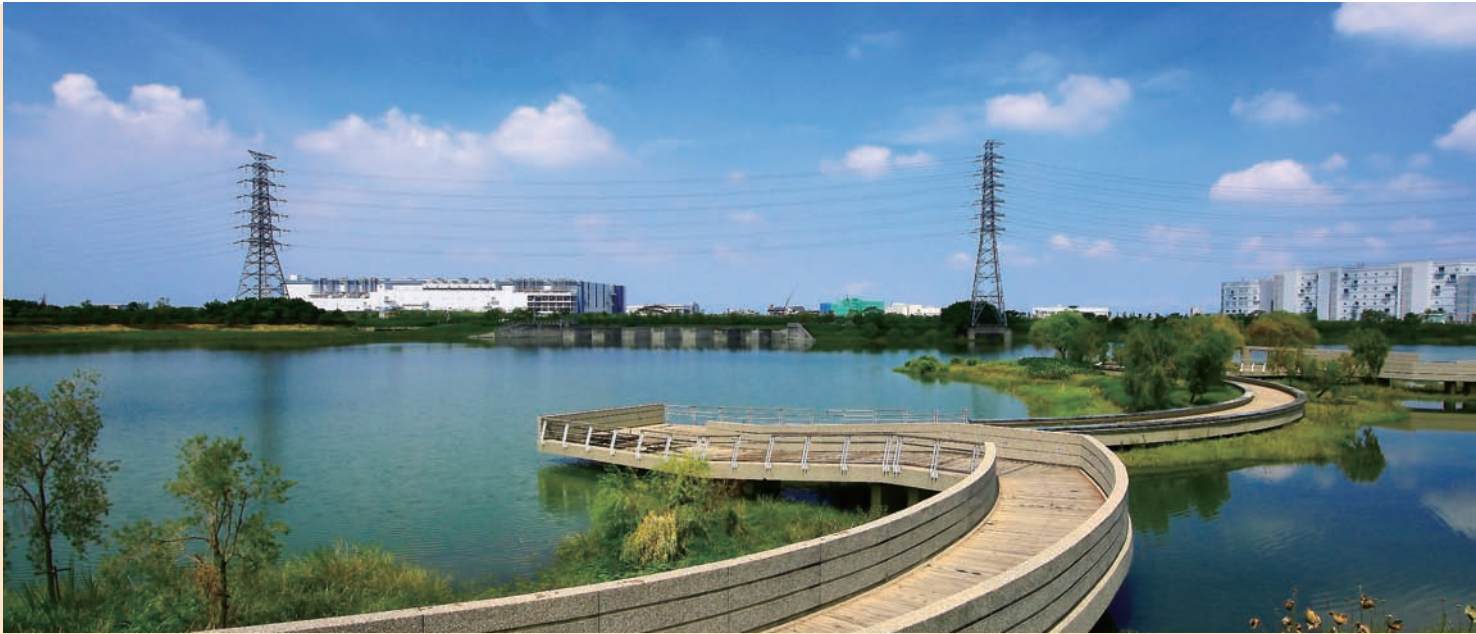
▼ 園區滯洪池有效發揮防汛功能