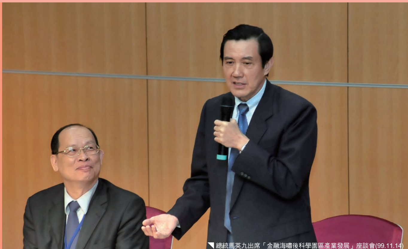
▼ 總統馬英九出席「金融海嘯後科學園區產業發展」座談會(99.11.14)