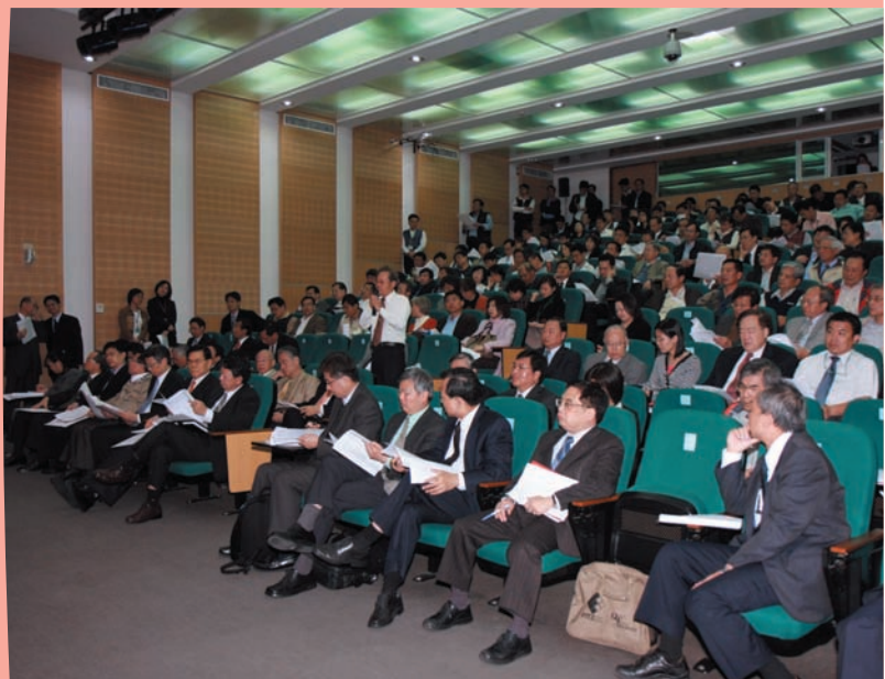
▼ 園區廠商踴躍參與座談會實況(99.3.11)