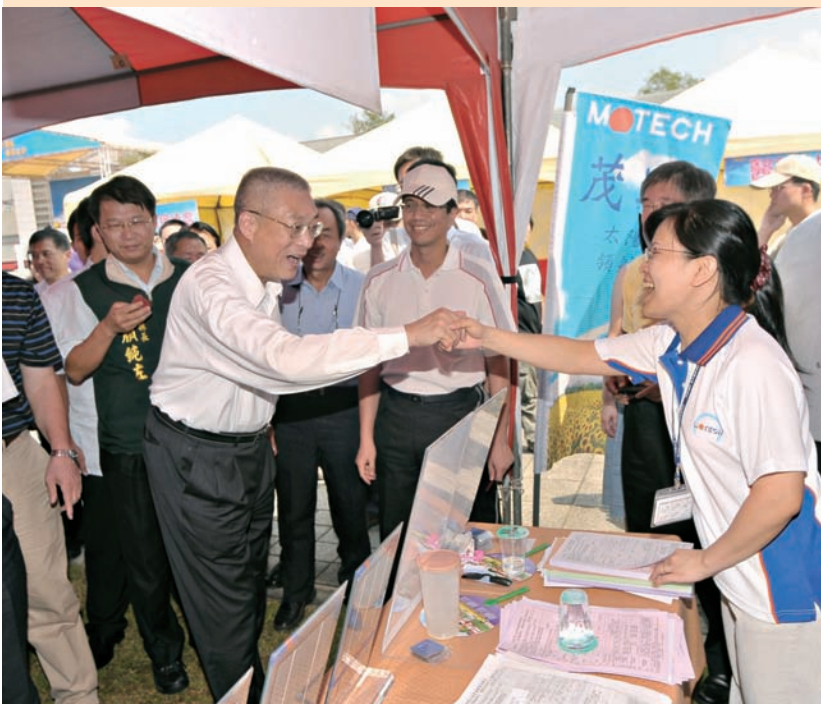
「廠商聯合徵才活動」行政院院長吳敦義問候徵才廠商(99.8.21)