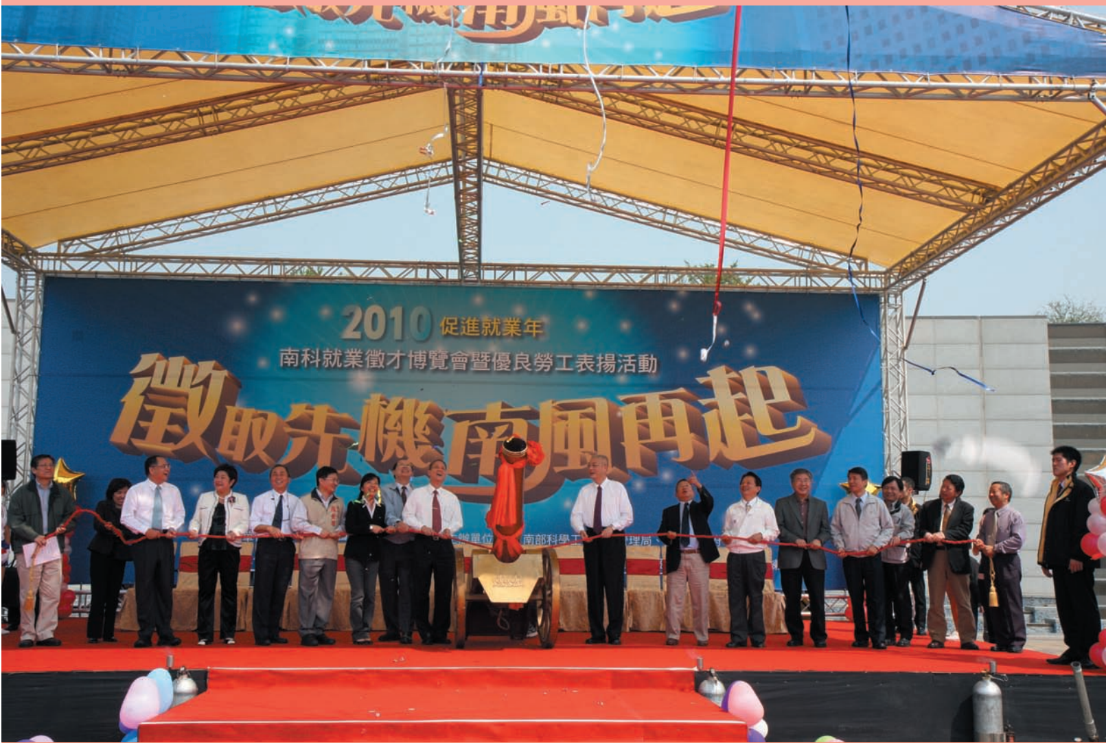
「就業徵才博覽會」與會貴賓共同啟動徵才活動典禮儀式(99.3.27)