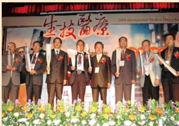
「南部生技醫療器材產業聚落發展計畫」國際研討會與會貴賓合照(98.11.3)