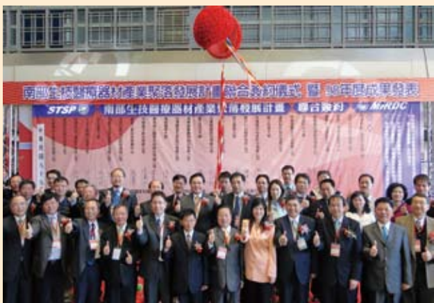
南部生技醫療器材產業聚落發展計畫聯合簽約儀式暨98年度成果發表(99.2.24)