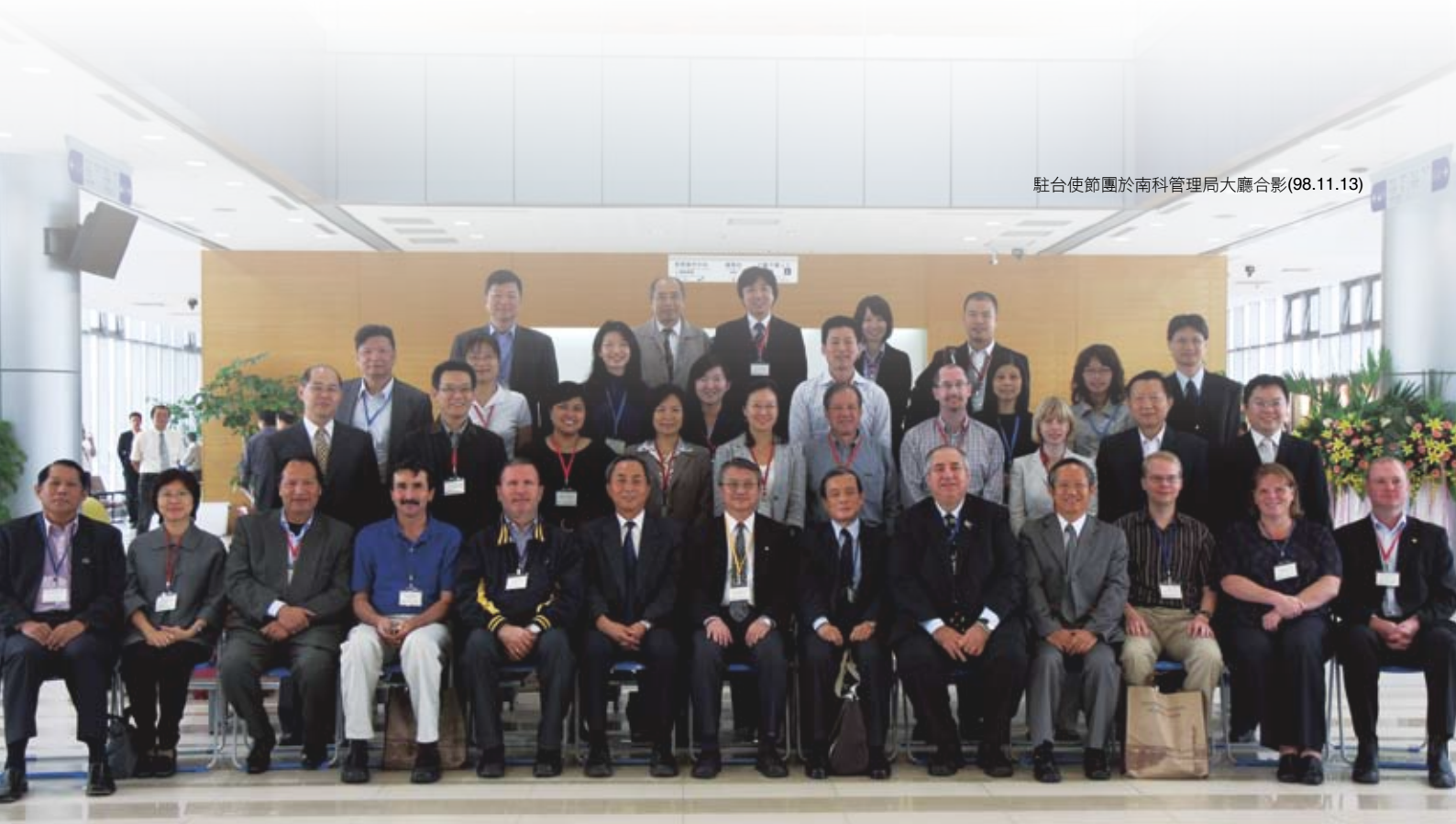
駐台使節團於南科管理局大廳合影(98.11.13)