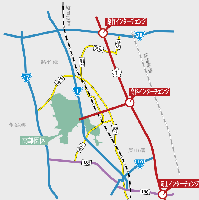
高雄園区交通マップ