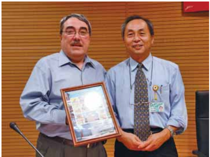
美國聯邦眾議院能源暨商業委員會G. K. Butterfield主席拜訪南科瞭解園區規劃與經濟現況(5月31日)

96年接待參觀訪客計198團6,530人次，包括國內外投資人、社團、學生團體、外交部安排的國際政要、新聞局安排的海外媒體等，透過多媒體簡報，協助來訪國內外賓客了解南科發展現況，也鼓勵參訪的學校團體未來從事高科技工作，並依據投資人需要，安排介紹園區相關環境以吸引投資。