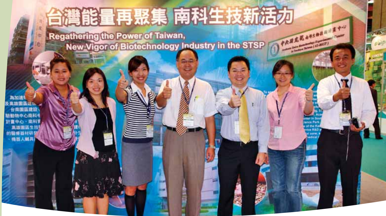
參加2007第5屆生技月Bio Taiwan活動(7月26日)