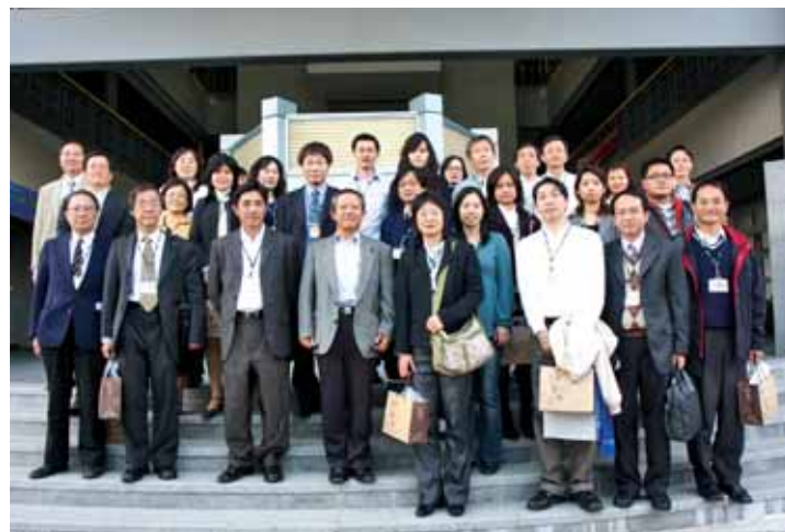
南科菁英體驗行—搭出南科的好(12月6日)