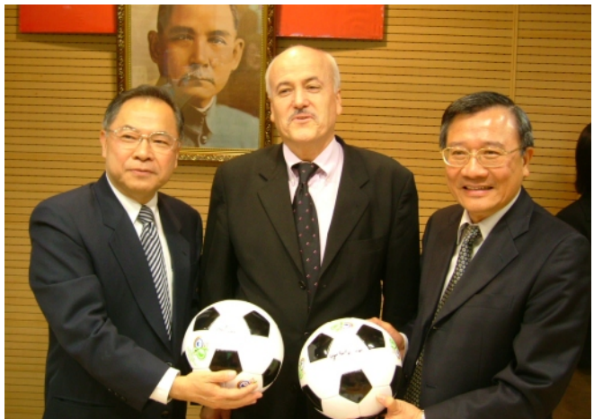
德國投資部長(中)特別帶2顆足球親自簽名送給南科管理局留念(3月29日)