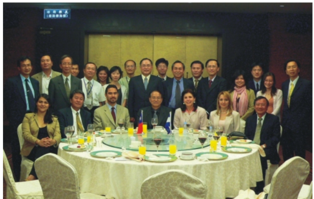
與薩國友人於晚宴時合影(4月21日)

薩國投資局該行的重要性在於中南美洲與美國簽訂自由貿易協定陸續生效而延伸之台薩兩國間之新投資商機。在參觀南科後，四位薩國友人對園區留下了深刻的印象。