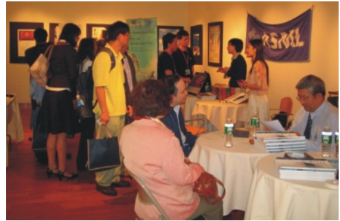
2006人才媒合商談會現場(9月7-17日)

95年訪問團與以前最大的不同是加入招商行程。尋求投資機會者，以生化、製藥的企業較多，尤其是找台灣的合作夥伴，也希望政府能參與投資；其次是軟體資訊業者，希望回台投資。