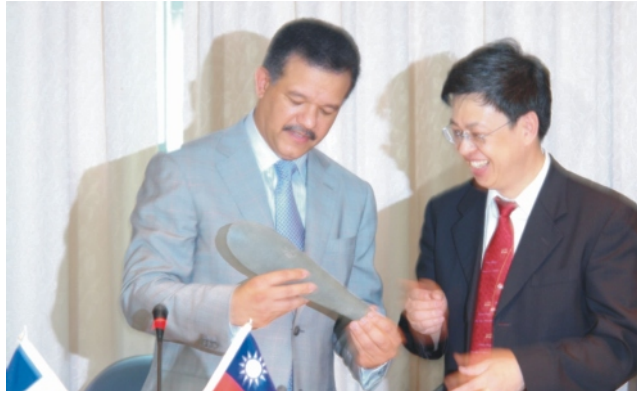
國科會主委陳建仁(右)致贈石斧予多明尼加共和國費南德斯總統(6月27日)

多國總統費南德斯懇切表示，對南科的發展十分佩服，除希望借鏡我國科技發展經驗，並表達希望透過台灣高科技產業的投資，形成台灣、多明尼加及美國東岸的新三角戰略關係，促進三方產業技術交流與經貿往來，創造雙贏局面。