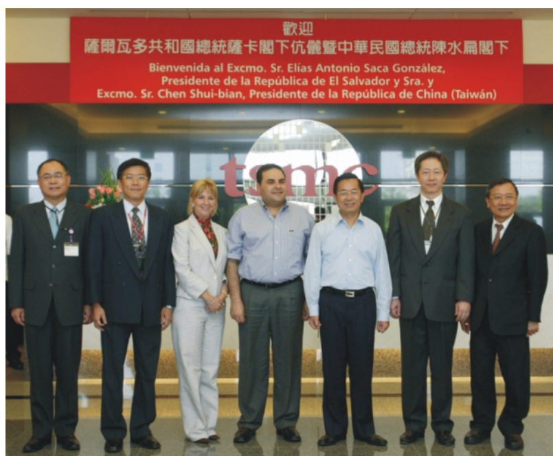
陳水扁總統(右3)陪同薩爾瓦多總統薩卡閣下伉儷(左3-4)參訪台積電(10月19日)

陳水扁總統第三次南下，由外交部安排於10月19日上午陪同薩爾瓦多總統薩卡閣下伉儷進行南科整體科技產業發展的視察與交流。該次視訪，不僅成功達成宣揚「深耕台灣、佈局全球」、「綠色矽島」之國家願景，也展現了南科有實力立足國際，將南科經驗推進國際，具體實現政府「前進中南美」之科技外交使命。