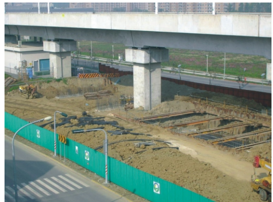
耐震構造加強基礎工事施工状況