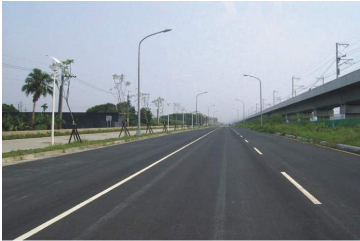
北側住宅区域と東1東2区開発工事(東2区道路)