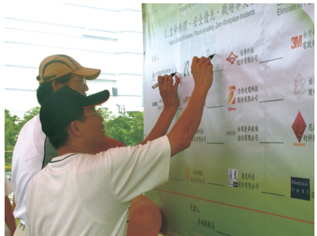
2005年工業安全環境保護月間開幕式兼メーカーとの工業安全環境保護宣言に署名(10月8日)

2005年6月12日から16日にかけて同地域に洪水が起こったが、洪水氾濫期間中、本管理局の緊急応変人員の即時的で迅速な緊急応変システムの起動によって、洪水発生警告情報等が適切に出された。園区内での災害が全くなかったことを受けて、メーカーからの高い信頼を受けることができた。本管理局が企画制定した洪水防止システムの高い信頼性が証明された。