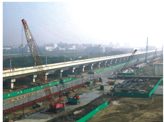
ハネ型振動減少壁施工状況

高速鉄道が2005年10月から列車動態測定テストを開始するのに合わせて、本管理局では2005年6月に選出された専門振動測量メーカーと振動減少測量テストを行うこととなった。既に設置された環境振動観測点と本工事で設置した効果測定点によって、高速鉄道の試行運転による振動値を測定・記録し、併せて振動に対して敏感な製品製造メーカーに直接訪問調査を行うなど、メーカー側の耐震に対する要求を汲み取り、園区企業の製造過程に与えるリスク軽減に向けた努力を継続していく。