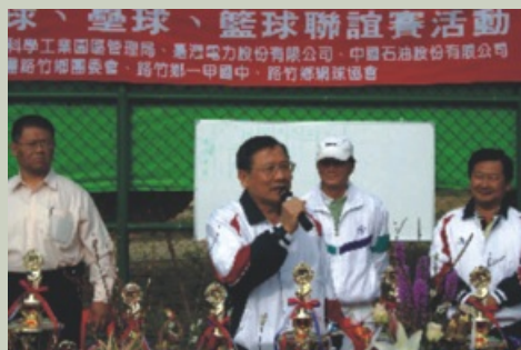
敦親睦鄰盃球賽開幕典禮(12月25日)