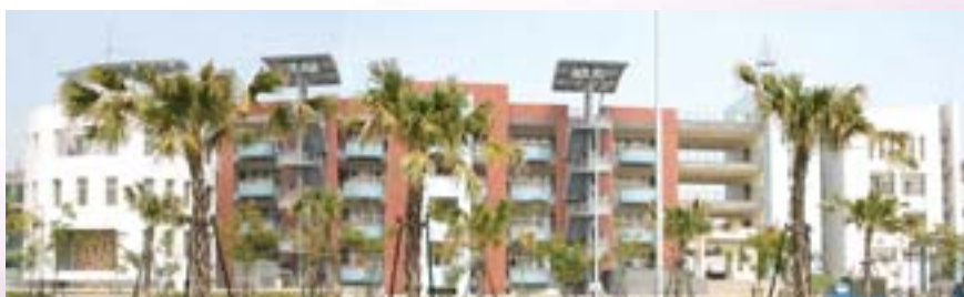
図 2-8 南科中學校