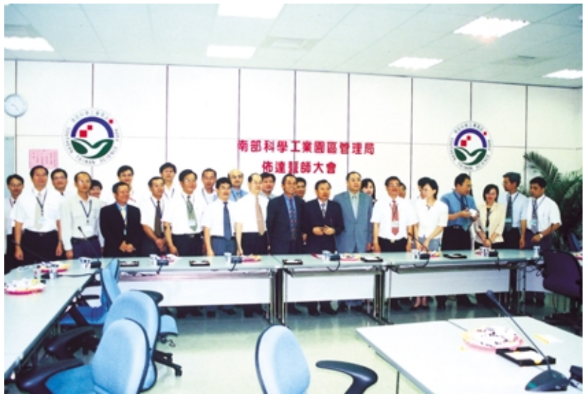
圖 3-1 新的組織人事佈達誓師大會

定，按業務性質調整為六組一室（如組織架構圖）；另為加速推動路竹園區整體開發及營運管理工作，增設路竹組。本局於九十二年六月二日以新的組織架構正式運作。